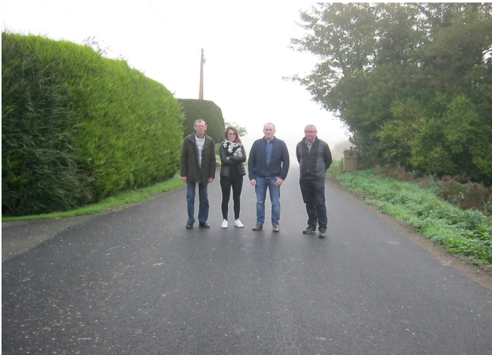
Réception de la voirie 2017 : route de kerismael , kergosmarec et caot hamon

En cette fin d'année 2017 , je vous souhaite à tous et à toutes de bonnes fêtes de fin d'année et vous invite aux vœux de la municipalité le 6 janvier 2018 à 11 heures .