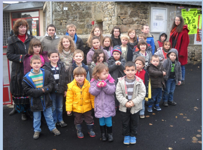
Photo du retour d'un spectacle à Kergrist Moelou

Réalisation collective d'un bonhomme de neige dans la cour de l'école