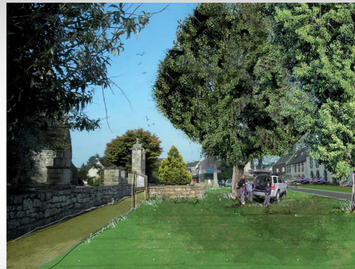
Futur aménagement de la place de l'église